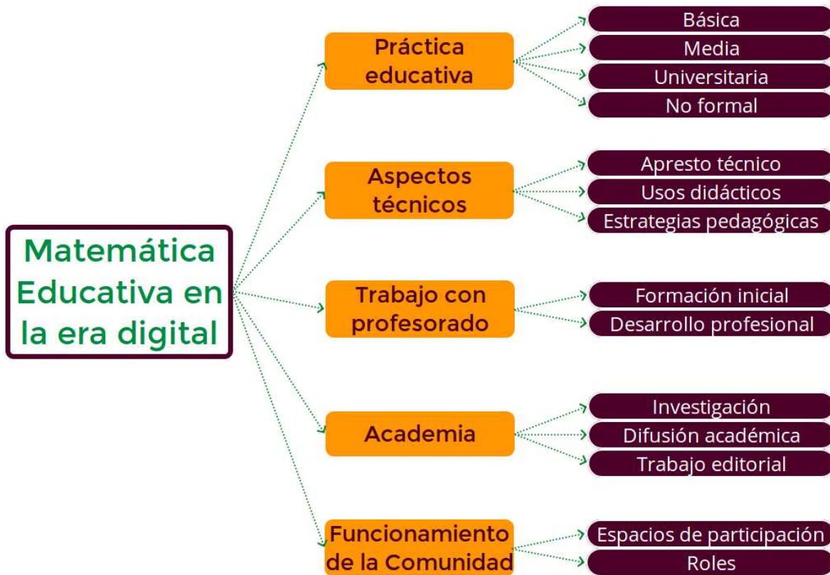
Imagen 1. Tematización de las actividades realizadas por la CGL en la región. (Elaboración propia)